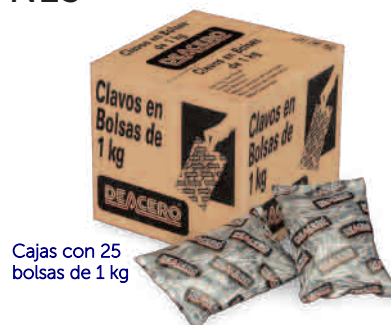
Cajas con 25 bolsas de 1 kg