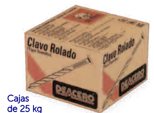
Cajas de 25 kg

(899)-455-70-11 & 455-70-12 & 128-80-40 pablo.gonzalez@qsource.com.mx www.qsource.com.mx